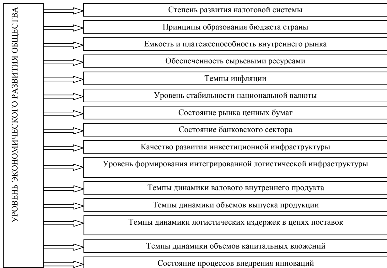
Рис. 2. Составляющие экономического развития общества как факторы формирования инвестиционного климата

ной логически обусловленной и крайне серьезной преградой на пути получения капитала предприятиями была стоимость его привлечения. Поскольку и в более стабильные периоды инвесторы воспринимали капиталовложения в украинскую экономику как достаточно рискованные, стоимость капитала обычно была достаточно высокой, что чаще всего приводило к невозможности реализации проектов. Но если цена привлечения капитала удовлетворяла потенциального реципиента, проект осуществлялся. В текущий момент потребность в капитале только возросла: большие средства необходимы на восстановление разрушенных объектов и хозяйственных отношений, создание благоприятных условий для эффективного функционирования предприятий. В то же время разрыв между потребностями и возможностями большинства субъектов, осуществляющих хозяйственную и экономическую деятельность, лишь увеличивается.