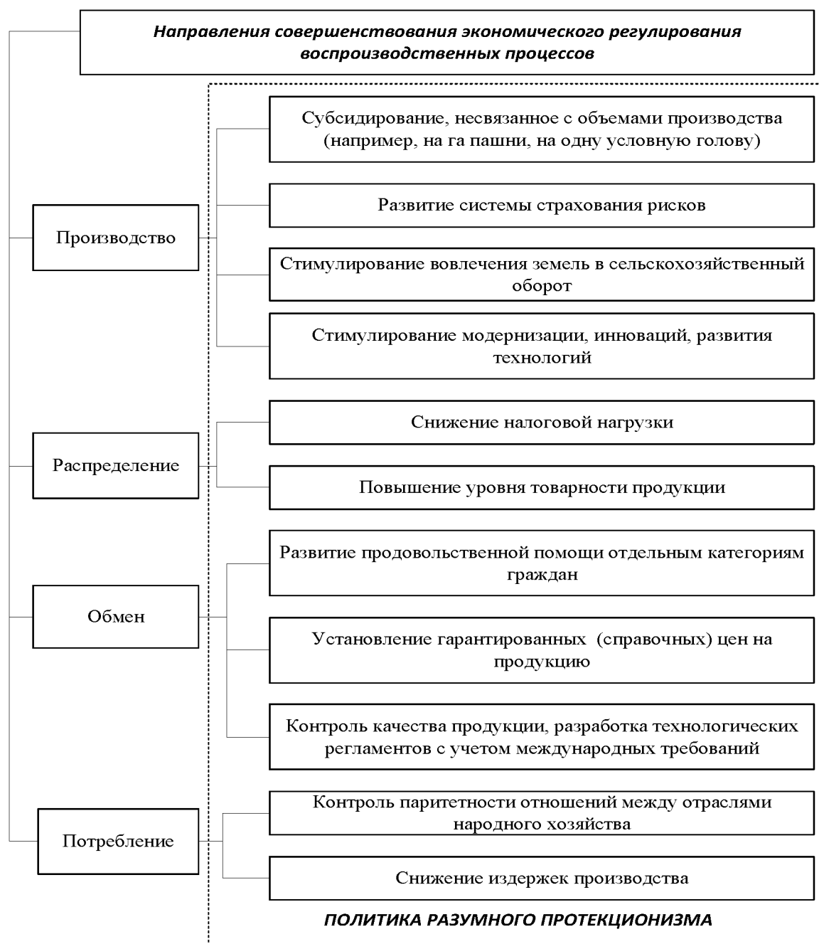
Рис. 3. Воспроизводственный подход к регулированию сельского хозяйства

В настоящее время не создана единая методология планирования, распределения и оценки эффективности использования бюджетных средств.