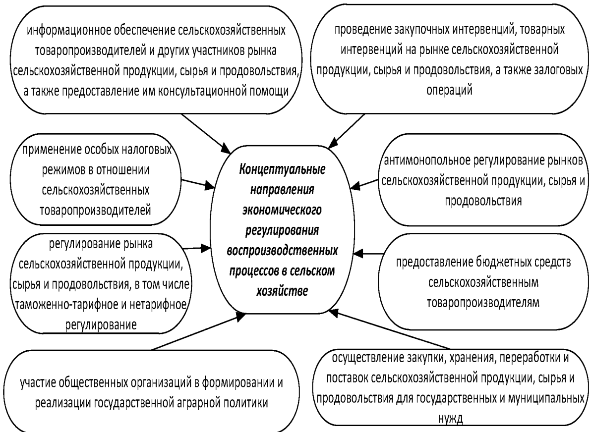
Рис. 2. Направления аграрной политики

Нерешенность системных проблем развития сельского хозяйства и агропродовольственного рынка препятствует преодолению противоречия между увеличением объемов государственной поддержки сельского хозяйства и импортом продовольствия, составившего в 2012 г. около 40 млрд. дол., что почти соответствует объему годовой выручки сельскохозяйственных