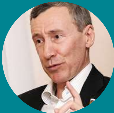
Андрей Аркадьевич Климов

Депутат Государственной думы (2011–2016), член фракции «Единая Россия», доктор экономических наук. Выпускник 1976 г.