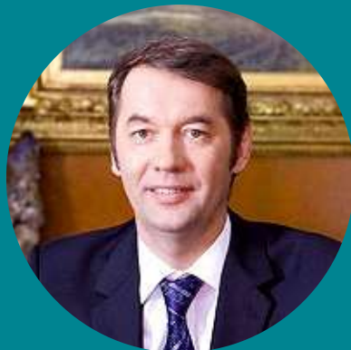
Андрей Равелевич Кузнецов

Депутат Государственной думы (2011–2016), член фракции «Единая Россия», доктор экономических наук. Выпускник 1976 г.