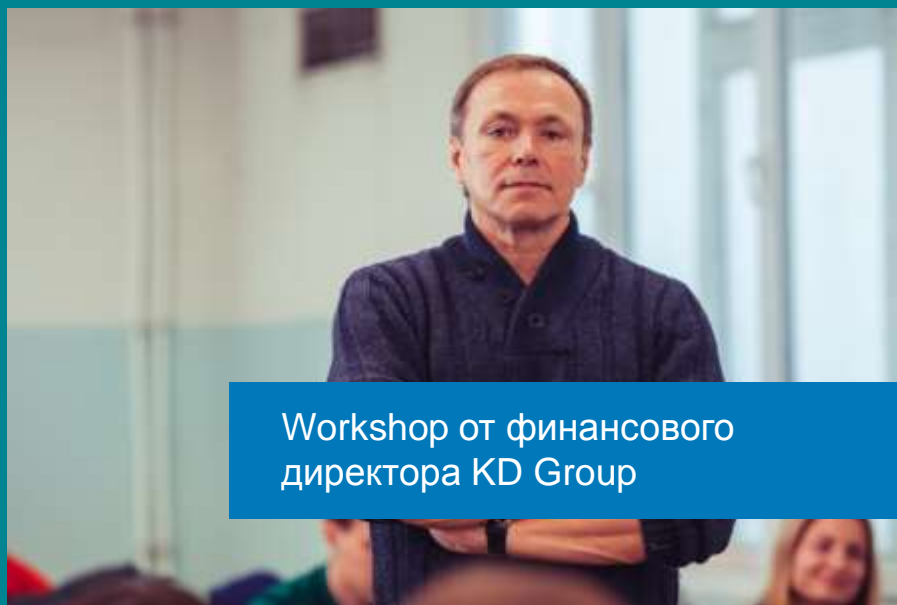
Workshop от финансового директора KD Group