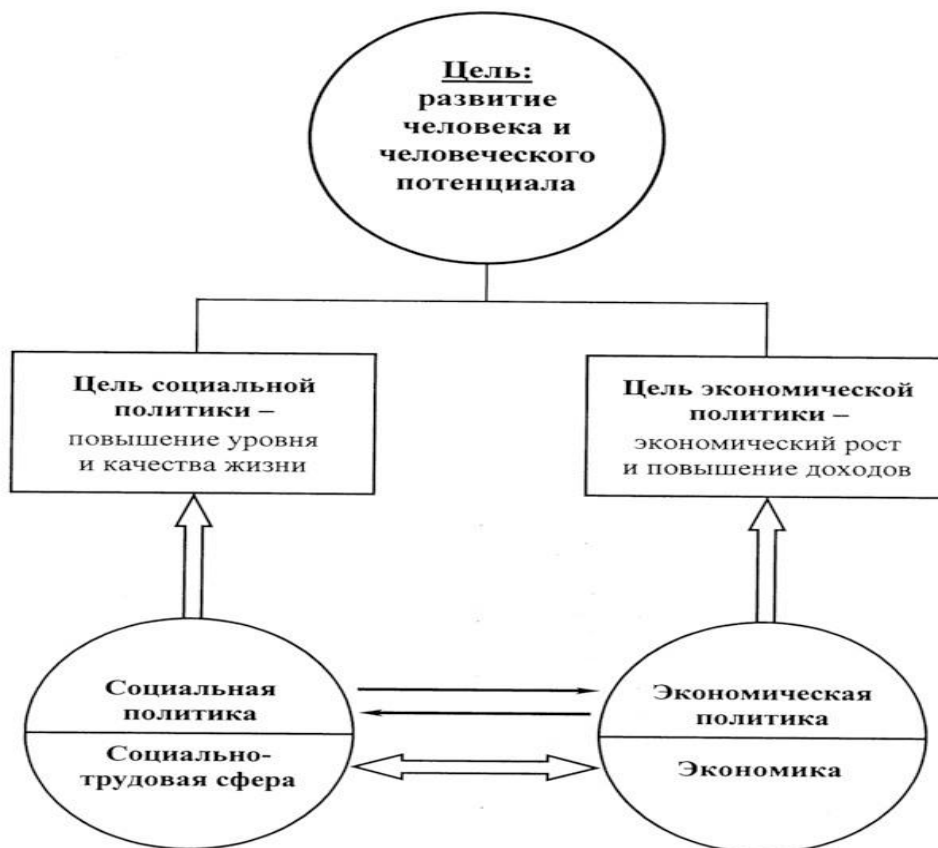
Рис. 1. Взаимосвязь социальной и экономической политики в развитии человека и человеческого потенциала [4]

Рассмотрим взаимосвязь социальной и экономической политики в развитии человека и человеческого потенциала (рис. 1).