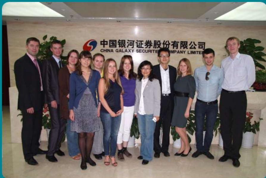
University of International Business and Economics, China