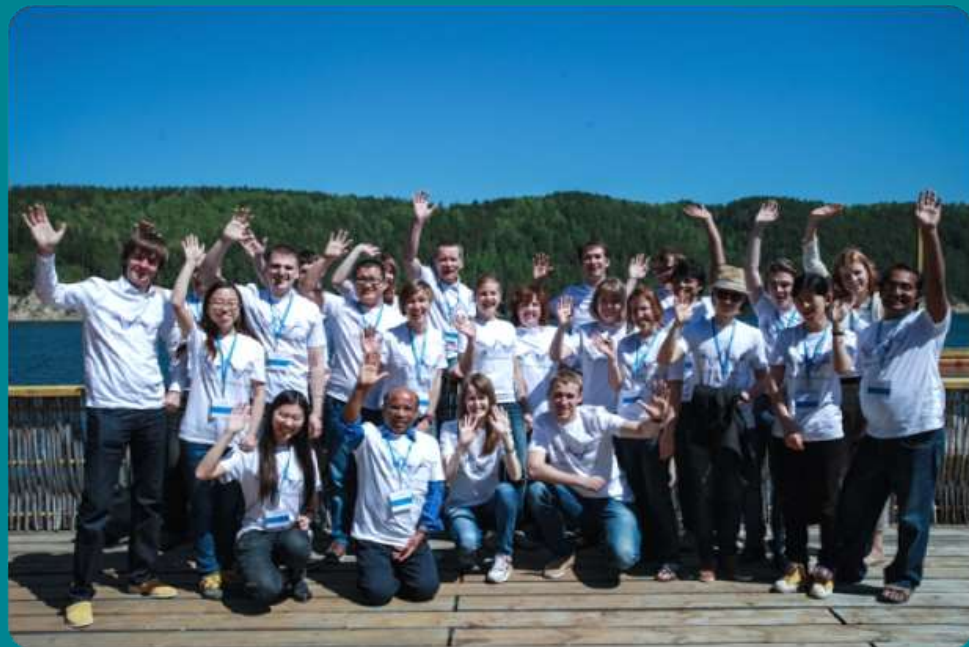
Prognoz Summer School